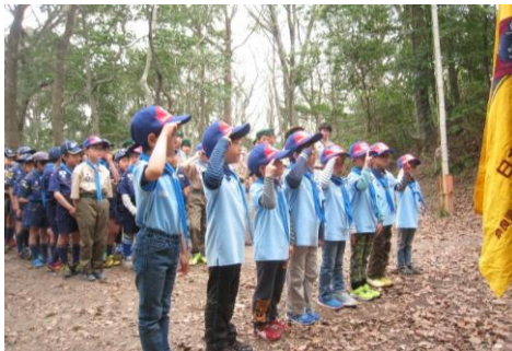
進級のセレモニーでそれぞれが進級いたしました ビーバー隊の上進伝達(1年生から2年生に)

4月3日(日)「上進式」ではビーバー隊、カブ隊、ボーイ隊、ベンチャー隊、ローバー隊も、それぞれ上進しました。父母合わせて130名以上の参加